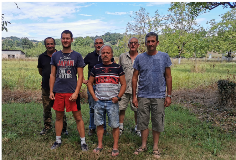
Les membres élus pour la saison 2020/2021