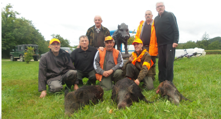
Photo souvenir de la saison 2019/2020

La réunion s'est déroulée dans la bonne humeur et la convivialité pour finir ensuite par un pot de l'amitié.