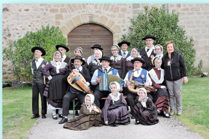
Les Echos Limousins d'Argentat