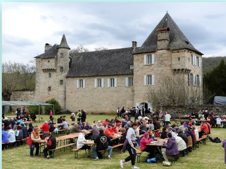
Le déjeuner au château d'Estresses