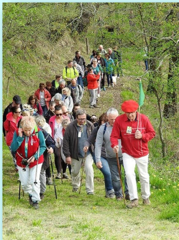
Nos marcheurs avec l'un des guides