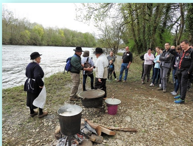
Démonstration de la lessive d'antan !