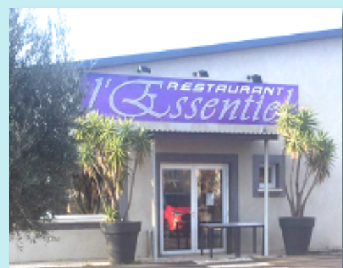
Restaurant : « L'Essentiel » à Pezenas (34)