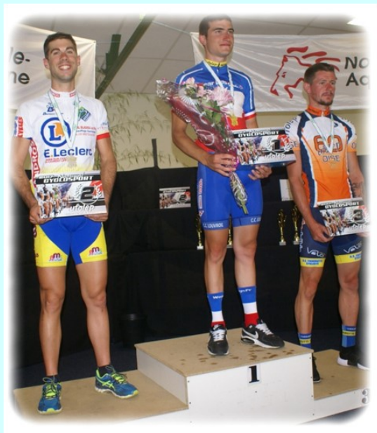
2 ème du Championnat de France